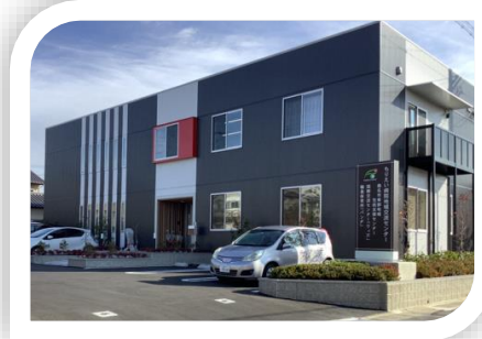
医療法人普照会もりえい病院 併設

東部 地域包括支援センター 【担当地区】 精義・立教・城東・ 修徳・大成 住所 内堀82 電話 24-8080