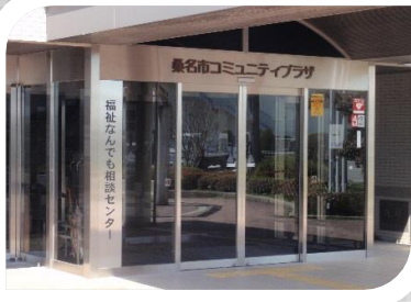
光精工コミュニティプラザ内