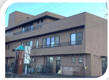
社会福祉法人 憩 内

西部 地域包括支援センター 【担当地区】 桑部・在良・七和・久米 住所 西金井170 電話 25-8660