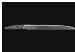
《短刀 銘 村正》館蔵

館蔵品の刀剣を中心に、一振一振異なる味わいをご紹介します。一つとして同じものない刀剣の魅力をご堪能ください。「川のように 風のように —江川香竹回顧展—」も同時開催します。