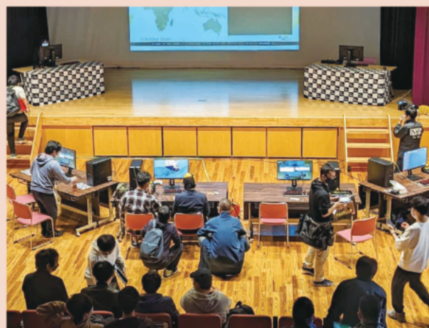
eスポーツ大会の様子