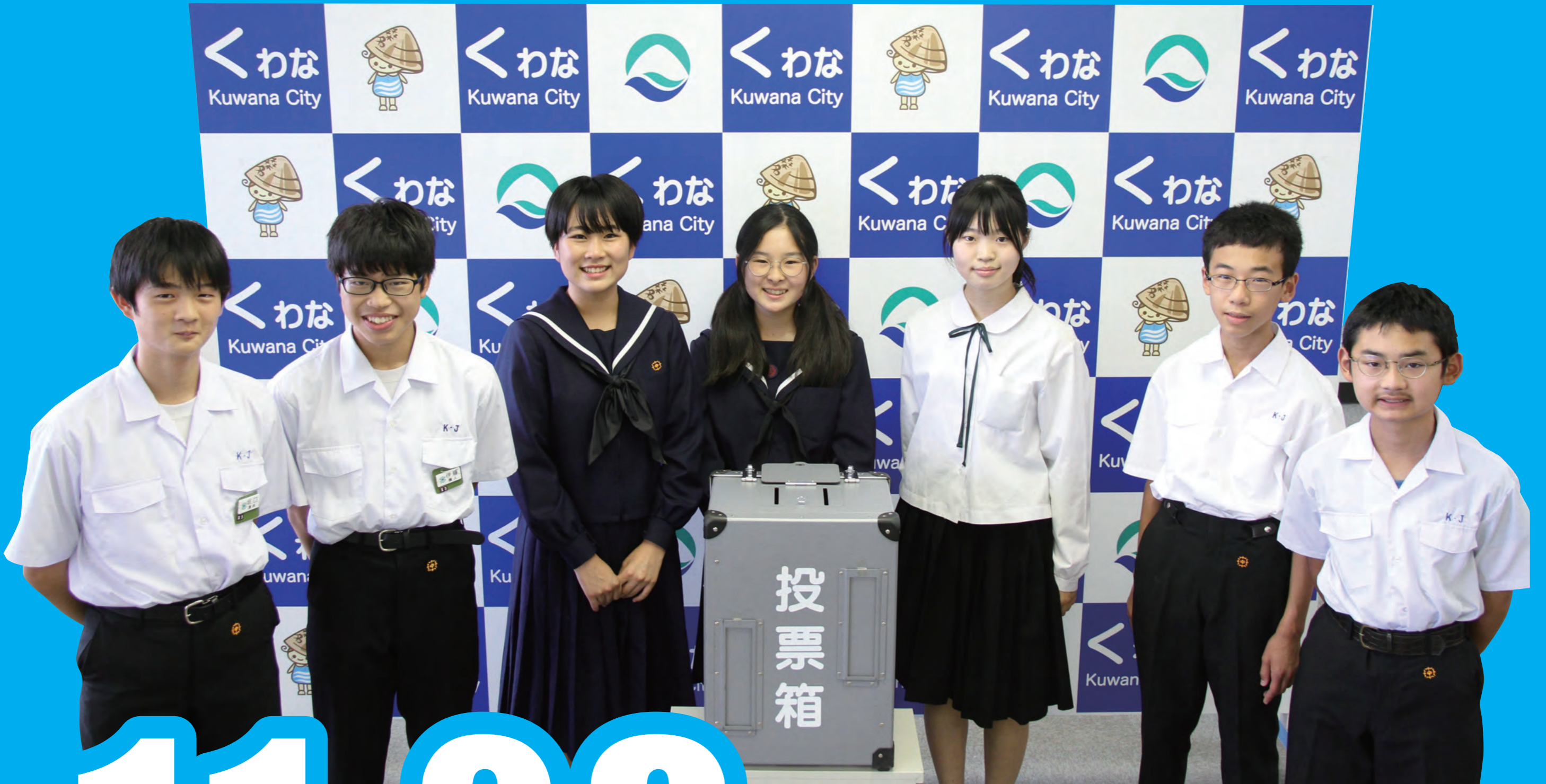
「桑名市投票率向上委員会委員」の市内中学生のみなさん