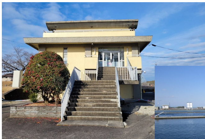
《桑名市上野浄水場》