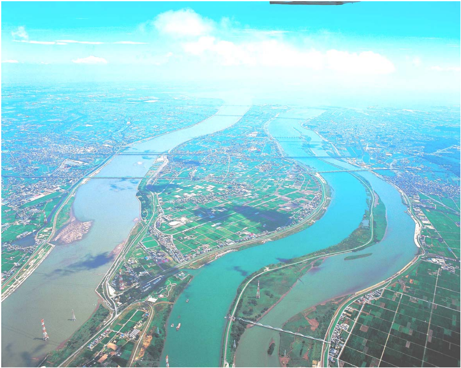
■空から見る木曾三川■