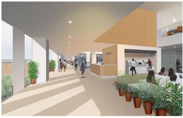
3階ホスピタルスパイン