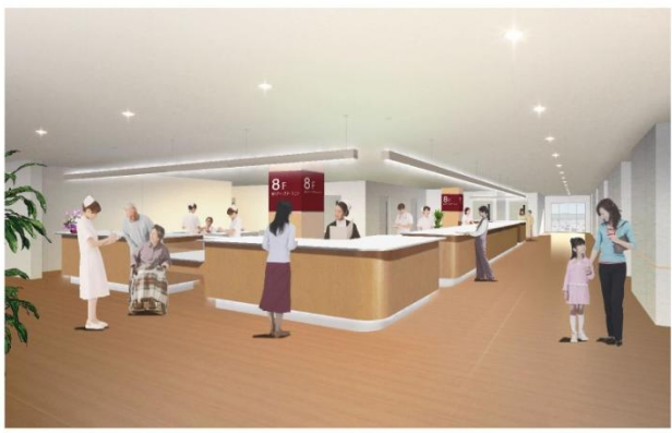
病棟スタッフステーション