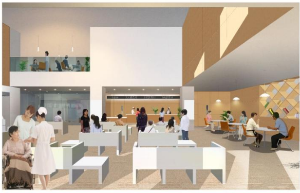
エントランスホール・総合受付