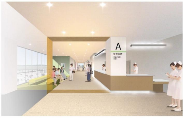
外来ブロック受付と待合