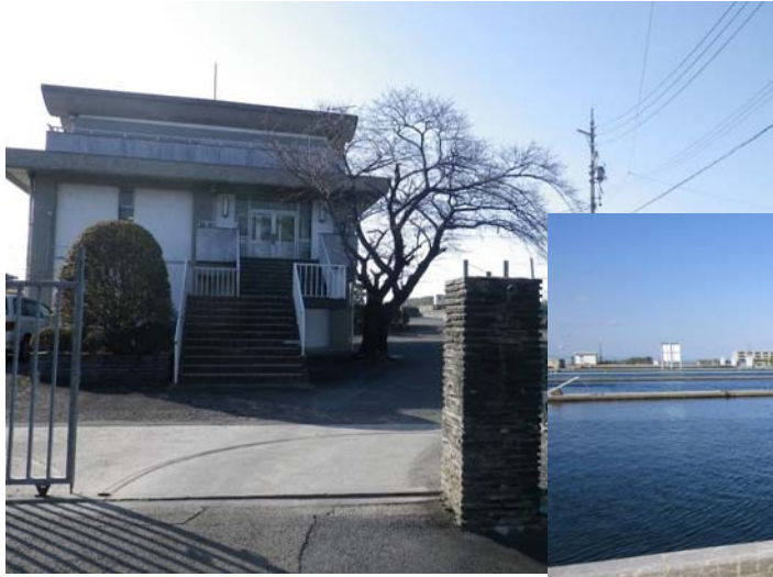
《桑名市上野浄水場》