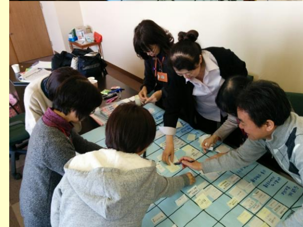
ワーキングチームによるケアパス作成の様子