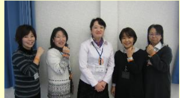
「認知症地域支援推進員」