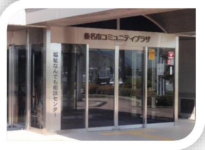
大山田コミュニティプラザ内