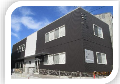
医療法人普照会もりえい病院 併設