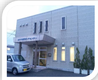
ヨナハ在宅ケアセンター 内