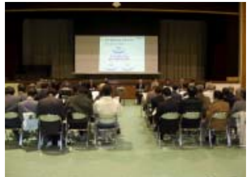
表 3-3 住民説明会開催状況