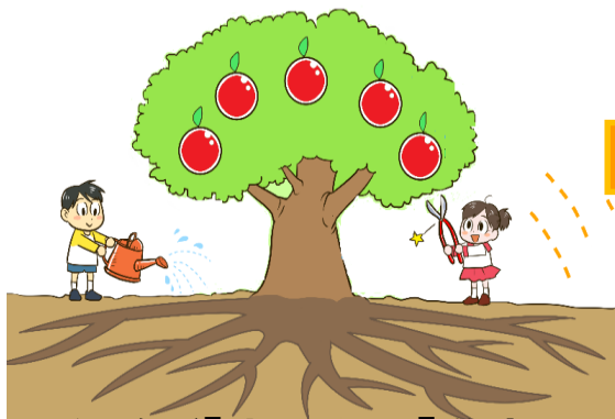
今までの「公民連携」

多様化する市民ニーズ、厳しい財政状況等、 山積する課題に対応するため『 公民連携 』の手法 を活用します。