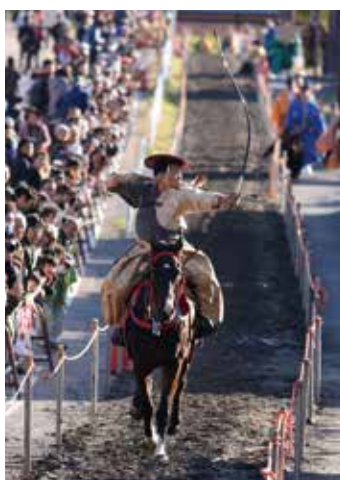
写真上：八壺豆（多度豆）写真中：多度祭の上げ馬神事 写真下：流鏑馬祭り。射抜かれた的は縁起物として受験生に人気。