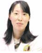
桑名市総合医療センター 桑名西医療センター 乳腺外来 (非常勤医師)

乳がんになる人は年々増えており、最近では女性の12人に1人の人が乳がんになると言われています。乳房は自分で触って、見る事ができるため、自分で検診をすること(自己検診)ができます。乳がんになった人の60%以上は自分で発見したとも言われています。