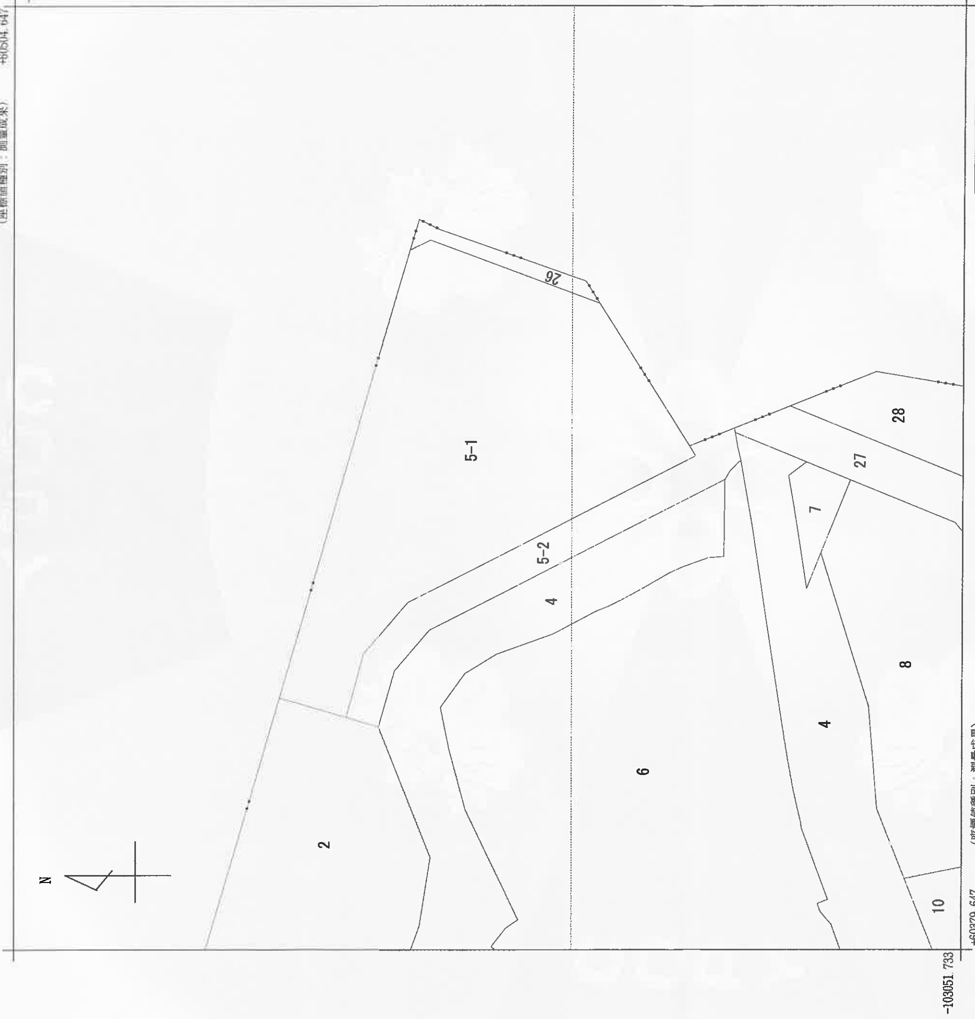
(座標値種別：測量成果)