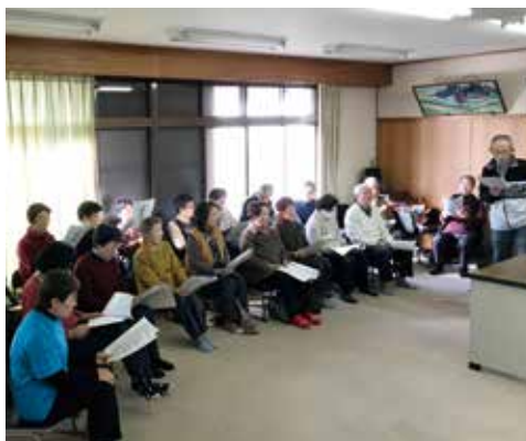
DVDに合わせて、みんなで歌を歌っています

額田いきいきサロンは、桑名いきいき体操の作成に携わった人が、「歩いて通える地元の集会所でも体操ができる機会を作りたい」と平成27年1月からスタートしました。 当初は、桑名いきいき体操を活用した見本となる通いの場が少なく、手探りで開始でした。 始めは桑名いきいき体操を2回実施することがメインでしたが、体力的にできない人が参加しづらくなるということから、体操は1回としました。また、宅老所「さくら」の運営にも関わっているス