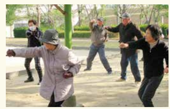
【いきいき体操会】(大山田第三広場の皆さん) 平成27年10月から体操を週1回続け、多くの皆さんが地域で一緒に運動する効果を実感されています。

いきいき体操を続けていてよかったことは何ですか？ ○わかっていても、自宅で一人ではなかなか運動はできない。やはりここに来てみんなとすることで運動が続けられる。 ○体力測定の値が上がった。つまりかないようになった。 ○自分は一人暮らしだが、ここに通うことで、社会の接点になると思えてくる。 ○最初は筋トレのところがしんどくて、「あく、えらい」と言っていたが、今では大丈夫になってきた。