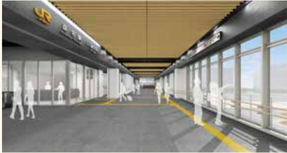
自由通路内完成イメージ