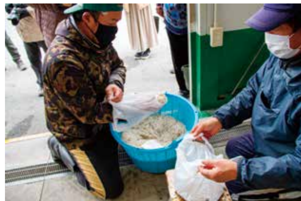
1/5 最高値は1kgあたり1万220円! シラウオの初競り 桑名の代表的な冬の味覚「シラウオ」の初競りが桑名港(赤須賀)で行われました。この日捕れた20kgのシラウオが競りにかけられ、次々と仲買人によって競り落とされました。