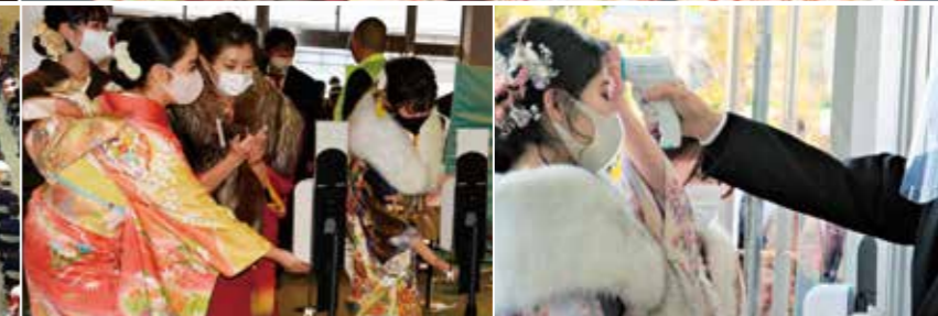
新型コロナウイルス感染症対策でNTNシティホールとヤマモリ体育館の2会場に分かれて、成人式が行われました。参加者はマスク、検温、手指消毒など対策を徹底しての開催でも久しぶりに会う友人との再開を喜び、これからの門出を祝っていました。