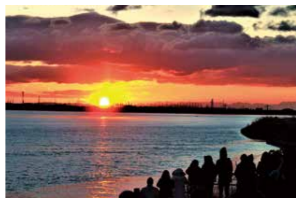
1/1 一年の幸せを願って 初日の出 今年は新型コロナウイルス感染症の感染拡大によって例年より住吉神社を訪れた人は少なかったですが、太陽が昇ると集まった人たちから歓声が上がりました。