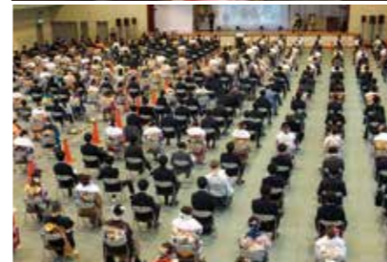
1/10 新たなスタイルで開催 成人式