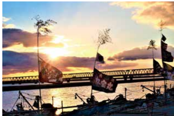
1/1-3 漁の安全を祈念して 桑名港(赤須賀)大漁旗 今年も漁の安全を願って、桑名港(赤須賀)に色鮮やかな大漁旗が掲げられました。漁船に掲げられた大漁旗は、とても華やかにはためいていました。