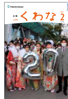
新型コロナウイルス感染症が拡大する中、開催を心配した新成人の皆さんでしたが、成人式が開催できたことに大変喜んでいました。