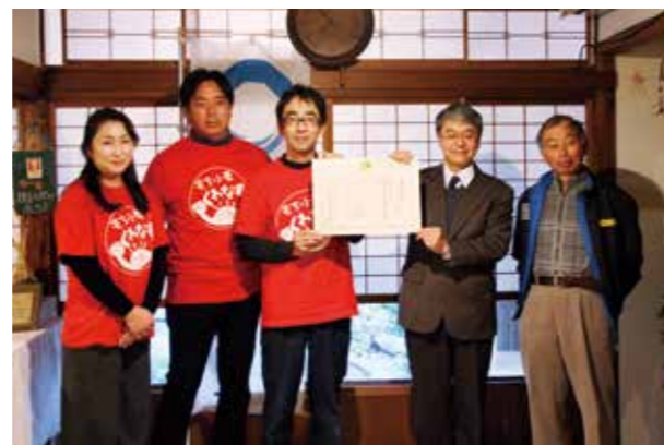
12/22 「桑名もち小麦協議会」が全国の優良事例に選定! 「ディスカバー農山漁村(むら)の宝」表彰 地域活性化の優れた取り組みを全国に発信する「ディスカバー農山漁村の宝」に選ばれ、東海農政局による表彰が行われました。これをきっかけにたくさんの人にもち小麦を食べていただきたいですね。