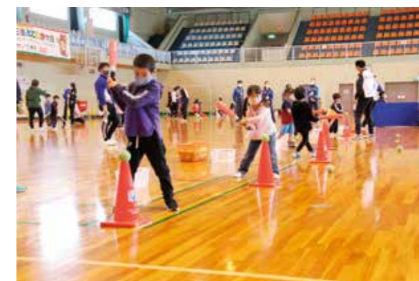
12/5 スポーツって楽しい! ヤマモリ体育館感謝祭2020