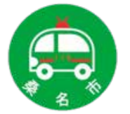
救急医療情報キットマーク

救急でご自宅などに伺った際に、冷蔵庫にこのマークが貼ってあるとものすごく安心できますし、頼りにできるので、皆さんもぜひ常備しておいてください。