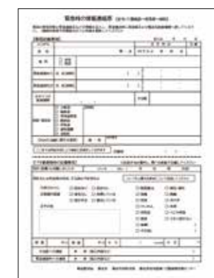
緊急時の情報連絡票