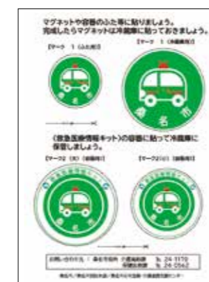
リーフレット裏面