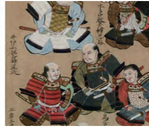
徳川十六将図:部分