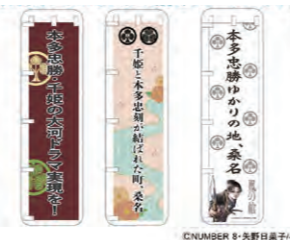
ステッカーのイメージ