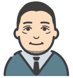
子ども総合センター長

「子どもの頃にどんな大人と出会うかで人生は変わると思うんです」 ドラマ「ユニコーンに乗って」の登場人物のセリフです。子どもの時は鳥の観察が大好きだったが、勉強は大嫌いで叱られることが多かった。う。けれど、ある先生と出会い、国語の勉強をすれば鳥の難しい本も読める、算数を勉強すれば数学で分析できるかもと丁寧に教えてもらい、勉強が好きになったと話していました。子どもは大人をモデルに成長します。家族だったり、学校の先生だったり、時にはプロ野球選手だったり…。市では、子どもの居場所事業を実施しています。そこでは、ボランティアスタッフが通っているお兄さんお姉さんなどいろいろな人たちと出会う場を作っていました。 また、私たちが子育て中のお父さんお母さん、子どもたちとすてきな出会いができたらと思っています。ちょっとした悩みも含めて、ぜひご相談を。