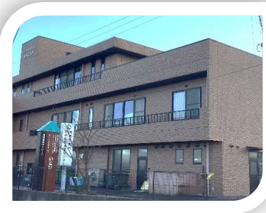
社会福祉法人 憩 内

東部 地域包括支援センター 【担当地区】 精義・立教・城東・ 修徳・大成 住所 内堀82 電話 24-8080