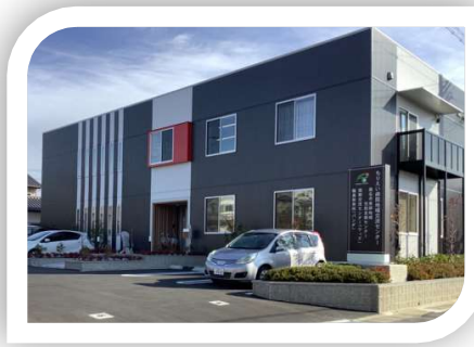
医療法人普照会もりえい病院 併設

南部 地域包括支援センター 【担当地区】 日進・益世・城南 住所 江場776-5 電話 25-1011