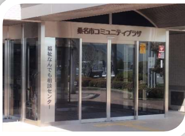
大山田コミュニティプラザ内