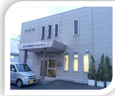
ヨナハ在宅ケアセンター 内

◆作成 桑名市役所 保健医療課 TEL 0594-24-0562 桑名市在宅医療・介護連携支援センター TEL 0594-22-8200 ◆協力 桑名医師会・桑員歯科医師会・桑名地区薬剤師会