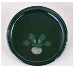
《桑名盆「かぶら盆」》館蔵

2階展示室にて、草花が描かれた盆や趣向を凝らしたかぶら盆など、多彩な図柄で彩られた桑名盆を展示します。また、刀剣セレクションIIでは、収蔵品の中から新たに展示デビューする刀剣をご紹介します。