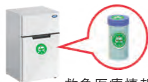
救急医療情報キット