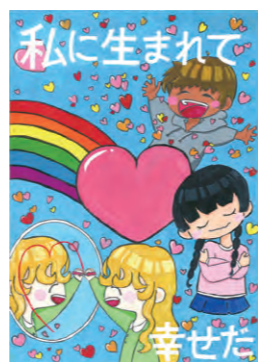
2022年度 桑名市「人権に関するポスター」入選作品