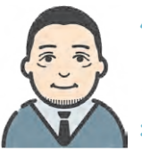
子ども総合センター長