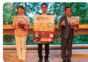
行田市長(左)と白河市長(右)と一緒に合同企画展のPR

皆さんもぜひ博物館の企画展「武門の遺産」にお越しいただき、200年前の大引っ越しを実感していただければと思います。