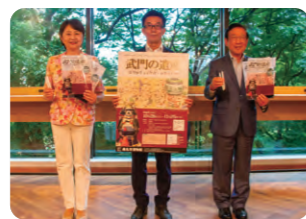
行田市長(左)と白河市長(右)と一緒に合同企画展のPR

皆さんもぜひ博物館の企画展「武門の遺産」にお越しいただき、200年前の大引っ越しを実感していただければと思います。