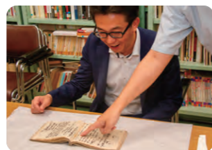
三方領知替の際に、桑名が行田へ移るマニュアルである移封記 ※撮影のためマスクを外しています