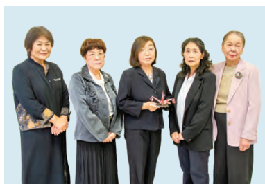
桑名の千羽鶴を広める会