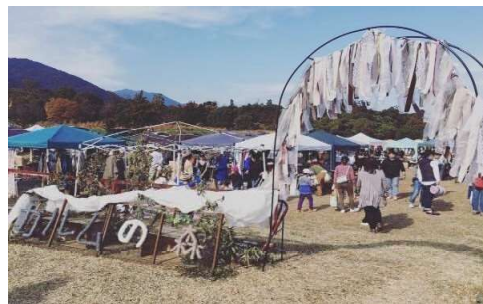
《過去開催実績の様子》

地域 の活性化に貢献できるイベントへ 魅力 の溢れる『桑名』を知ってもらい市内外から人の 集まるマチ へ チャレンジ したい人が活躍できるきっかけの 場 を作り 桑名の自然・文化・歴史資源を活用した 持続可能 なイベントにしたい →歴史ある場所に多くの人を呼び込み知ってもらう