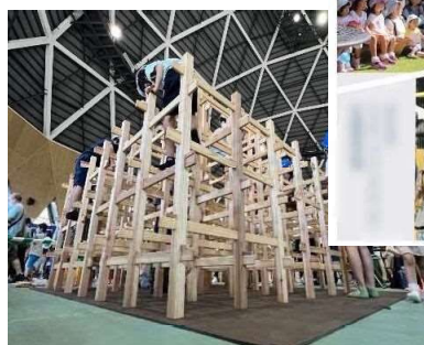
《木製ジャングルジム》