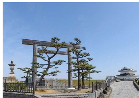
《会場付近 七里の渡跡》

日時： 令和 5 年 11 月 4 日(土)、5 日(日) 10:00～16:00 予定 会場：揖斐川河口周辺エリア 入場料： 無料 (来年以降は要検討)