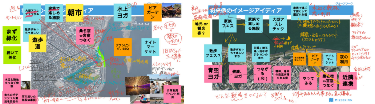
WEB ホワイトボードでいただいたご意見