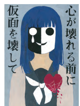
2022年度 桑名市「人権に関するポスター」入選作品