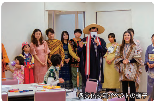
多文化交流イベントの様子