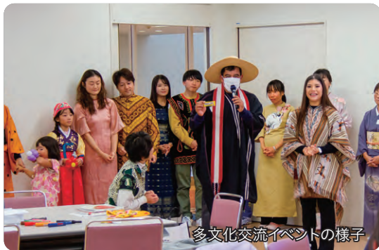
多文化交流イベントの様子