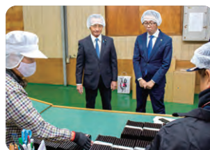
服部組合長から桑名の海苔の おいしさをお聞きました

全国的に、海苔の不作が続いていますが、今年、桑名の海苔の生育は順調とのこと。市民の皆さん、ぜひ地元で採れた美味しい海苔をご賞味いただければと思います。