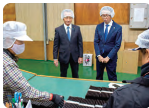
服部組合長から桑名の海苔の おいしさをお聞きました

全国的に、海苔の不作が続いていますが、今年、桑名の海苔の生育は順調とのこと。市民の皆さん、ぜひ地元で採れた美味しい海苔をご賞味いただければと思います。