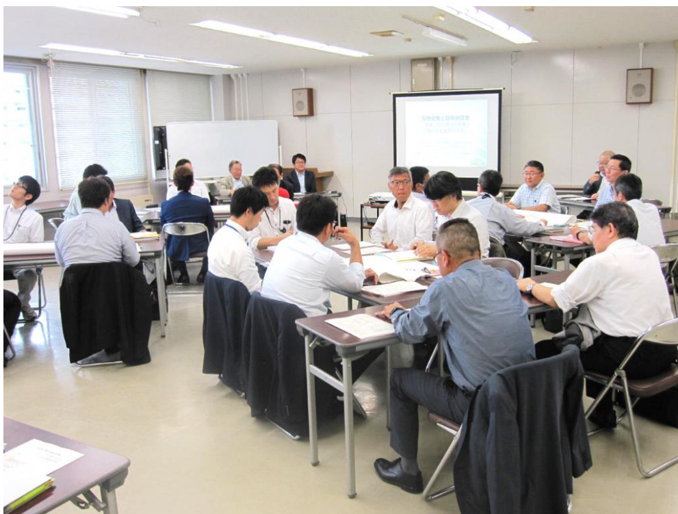
桑員地区 BCP 作成委員会の様子 (2019 年 10 月 11 日)

今までに BCP 作成のための講習会やワークショップを 4 回開催 (2019 年 5 月 20 日、7 月 30 日、10 月 11 日、2020 年 1 月 14 日) 今年度中に地区内に所属する医療機関の BCP 策定を終了する予定