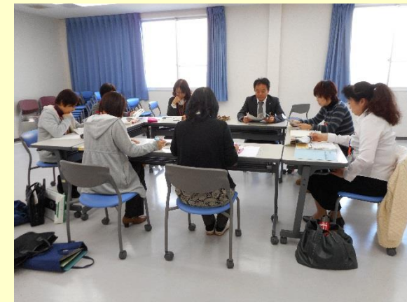
平成26年12月3日 「『認知症ケアパス』ワーキングチーム」