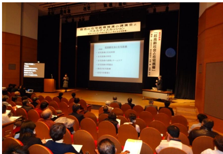
平成26年2月9日 「桑名の在宅医療推進の 講演会とパネルディスカッション」