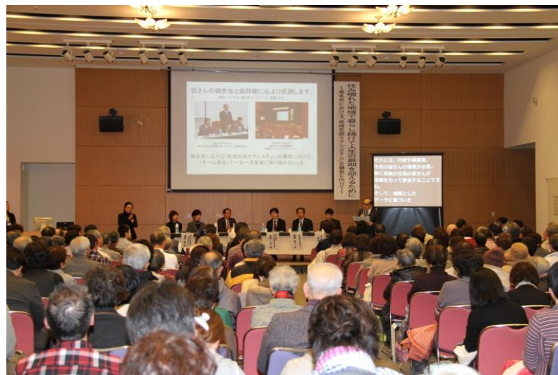
平成26年2月22日 市民公開講座 「住み慣れた地域で暮らし続けて人生の最期を迎えるために ～桑名市における『地域包括ケアシステム』の構築に向けて～」

桑名市における「地域包括ケアシステム」の構築に向けて、 「オール桑名」で一步一步着実に取り組みましょう。