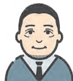
子ども総合センター長

皆さんはACEs(逆境的小児期体験)という言葉をご存じでしょうか。ACEsとは、児童虐待やいじめ、両親の不仲や話を聞いてもらえなかったなどの子ども時代の心のけがのことを言い、それらにより、生活習慣病、精神疾患、ひどい場合には薬物などの依存症、ひきこもりや自殺企図などの原因とも言われています。 しかし、ACEsがある人全てにこれらの症状が生じるわけではありません。ACEsがあっても「自分の気持ちを話すことができた」「周囲の大人がつらい時に支えてくれた」「家族や仲間の一員という感覚があった」というPCEs(ポジティブな子ども時代の体験)により、症状を防いだり、緩めたりできると言われています。 PCEsは、家族はもちろん、周囲の私たちができることでもあります。困っている子どもがいたら、じっくり話を聞いてあげましょう。