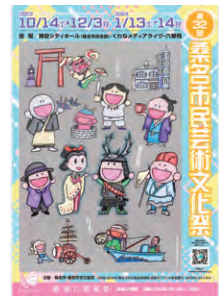
令和5年度優秀賞作品