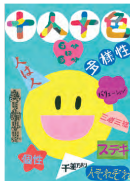
2023年度 桑名市「人権に関するポスター」入選作品