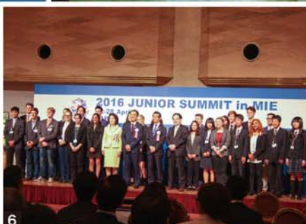
1.ナガシマリゾート全体図 2.外観 3.瀧の湯 4.花翠の間(コンベンションホール) 5.ハワイエ 6.外務省主催ジュニア・サミットの様子