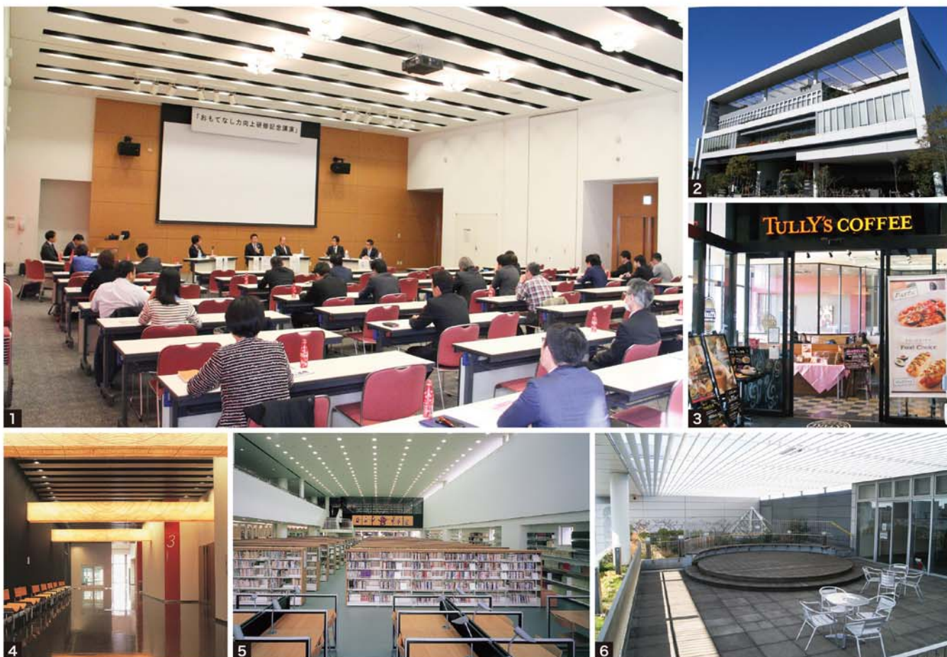
1.多目的ホール 2.外観 3.コーヒーショップ 4.廊下 5.図書館 6.図書館「天空の庭」

開放感あふれる空間により次世代に柔軟にアプローチできる メディアセンターを目指しています