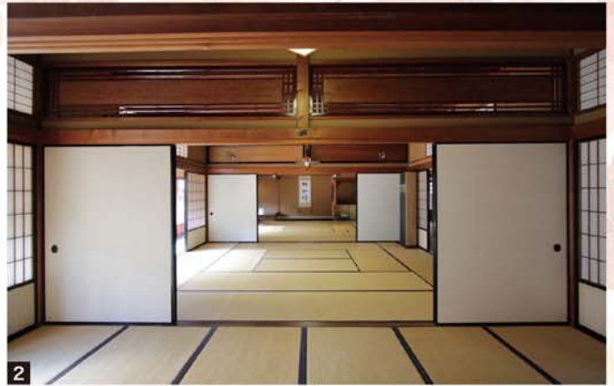
1.六華苑(外観) 2.和館一の間