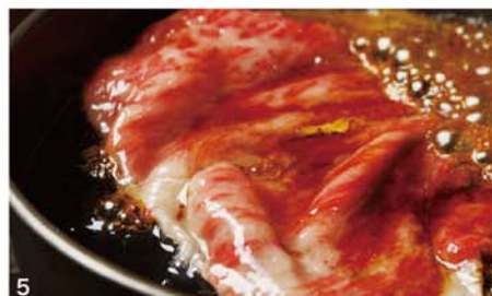
1. お座敷遊び 2. 和菓子作り体験 3. 「石取祭」祭車 4. 焼きはまぐり(桑名丁子屋提供) 5. すき焼((株)柿安本店提供)