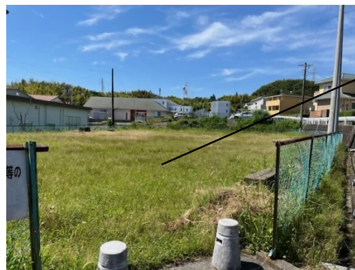
旧ゲートボール場