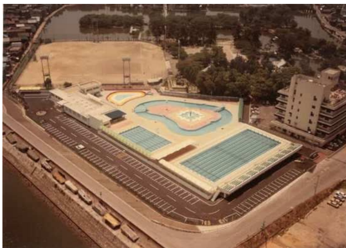
完成時の航空写真