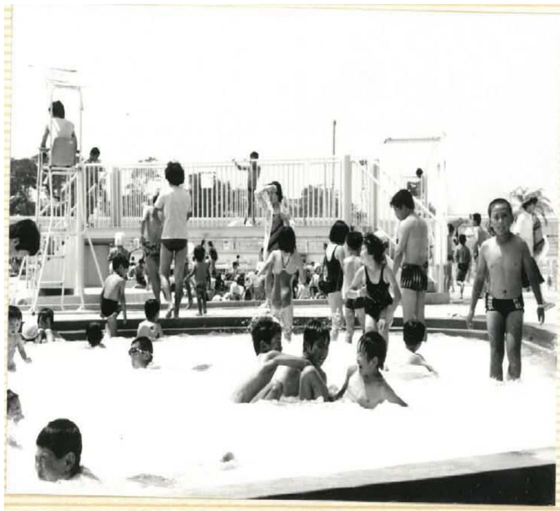
昭和58年広報7月1日号