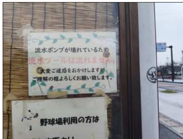
起流ポンプ故障案内