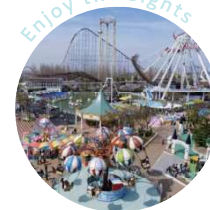
Enjoy the Sights

九華公園の桜まつり、桑名水郷花火大会、多度山のハイキングなど、四季折々の自然を身近に感じながら暮らせる環境があります。都市の便利さを享受しながら、自然と四季をすぐそばに感じられます。