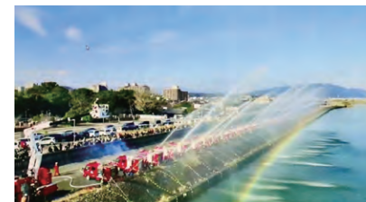
昨年の一斉放水会場の様子

とき 1/18(日) 11:20ごろ 場所 揖斐川右岸「住吉浦休憩施設」付近(太一丸地先)