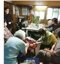
オレンジカフェの様子

※開催予定・活動内容・認知症に関する相談窓口については市ホームページ(QRコード)からご確認ください。