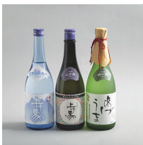
細川酒造(株) (上馬 BEER・純米酒)