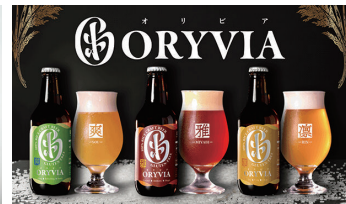
RICE HACK BREWERY (お米100%クラフトビール「ORYVIA」)