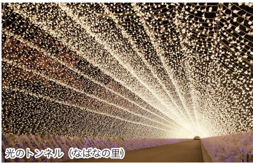
光のトンネル (なばなの里)