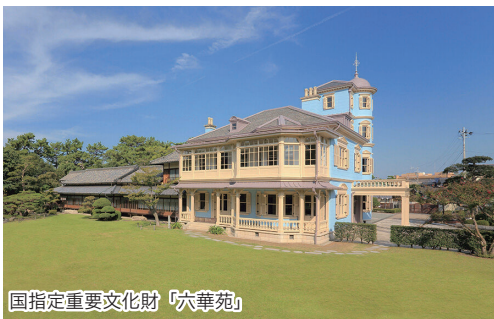
国指定重要文化財「穴華苑」