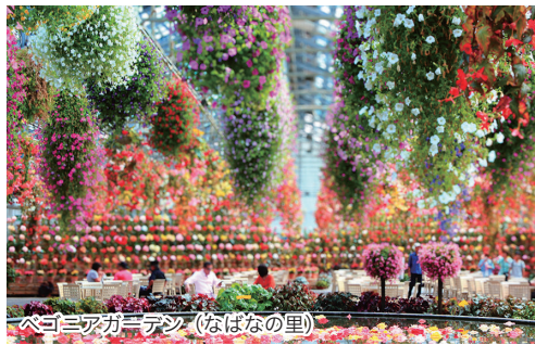
ペゴニアガーデン (なばなの里)