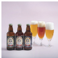
ナガシマリゾート (長島ビール)