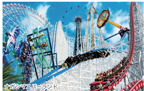
ナガシマスパーランド