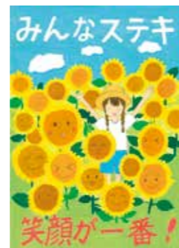
2025年度 桑名市「人権に関するポスター」入選作品