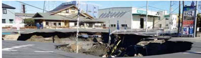
埼玉県八潮市の事故の様子

市では、大きな事故にはつながっていませんが、最近では特に給水管からの漏水が目立ってきています。年間10キロを目標に進めている耐震性のある配水管への布設替えと合わせて給水管の更新も行っていきます。