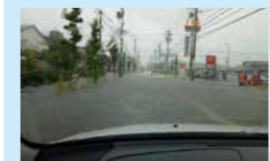
昨年7月大雨時の江場地区の様子

江場地区の下水道事業による雨水整備区域を拡大し、浸水対策の強化を図るため、排水経路や雨水ポンプ場の計画の見直しを行います。