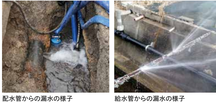
配水管からの漏水の様子