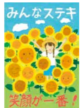
2025年度 桑名市「人権に関するポスター」入選作品