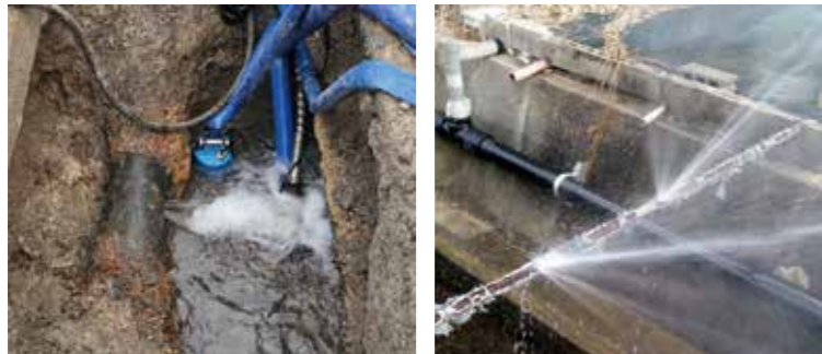
配水管からの漏水の様子