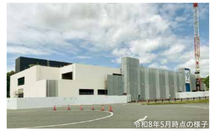
令和8年5月時点の様子

現在、市では屋内温水プールの整備を行っています。これまで夏季限定だった屋外プールとは異なり、季節や天候に左右されず、年間を通して水泳や水中ウォーキングをお楽しみいただけます。多くの皆さんにご利用いただけるよう、完成に向けた準備を進めてまいります。