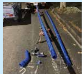
耐震性のある配水管

基幹管路の耐震化を進めるとともに、地震による管路の破損や断水リスクを最小限に抑えるため、避難所などの重要施設への給水機能の維持を優先しながら老朽化した配水管を耐震性のある配水管へ布設替えを進めます。