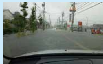
昨年7月大雨時の江場地区の様子

江場地区の下水道事業による雨水整備区域を拡大し、浸水対策の強化を図るため、排水経路や雨水ポンプ場の計画の見直しを行います。