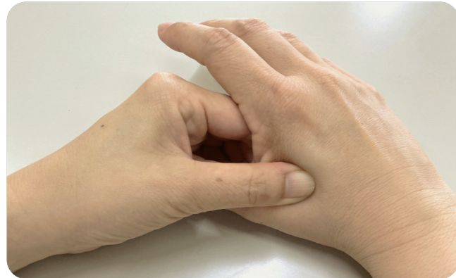
頭痛、生理痛などの痛みには効果があるツボ