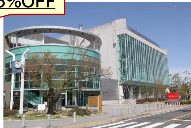
柿安シティホール