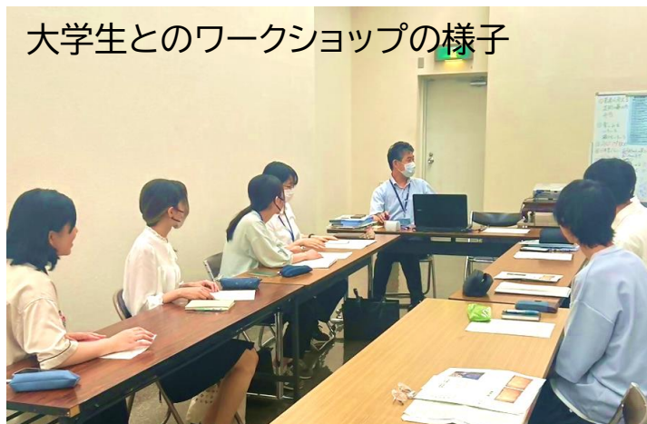
大学生とのワークショップの様子