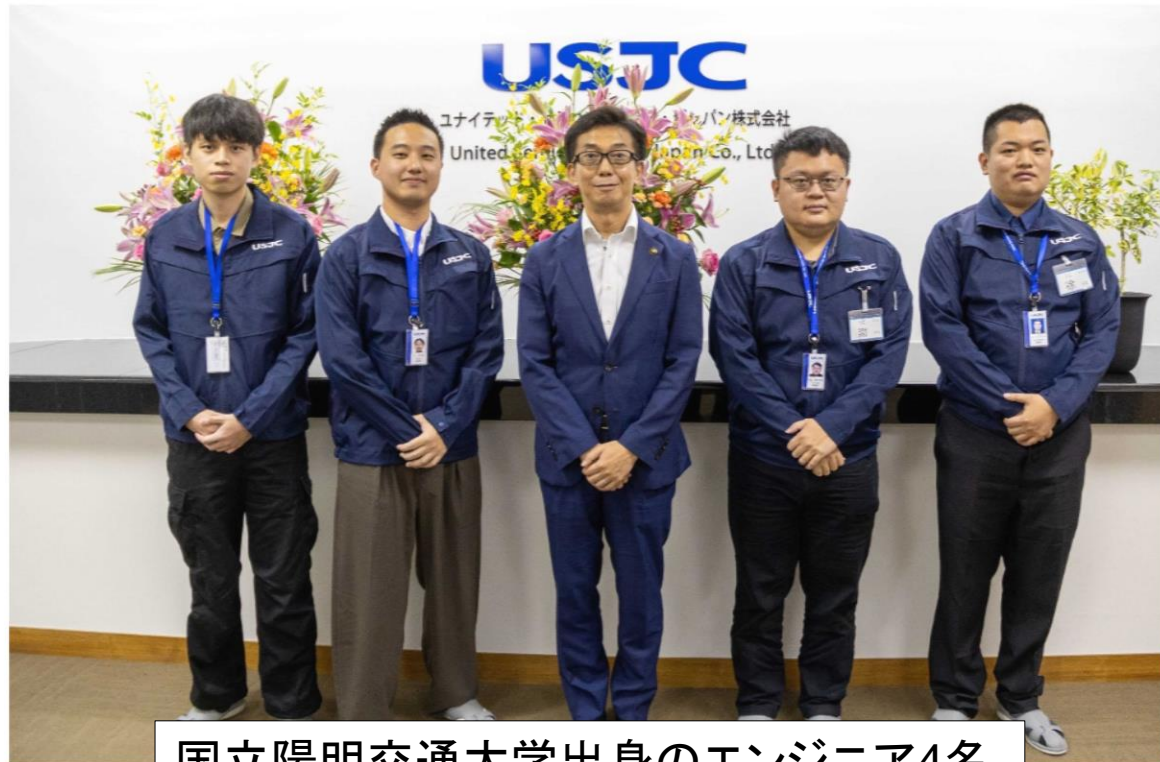
国立陽明交通大学出身のエンジニア4名