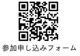
参加申し込みフォーム

申込 パソコンなどで、参加申し込みフォーム (https://forms.gle/rcMpNcFt2SPbsGJP6) から申し込みしてください。